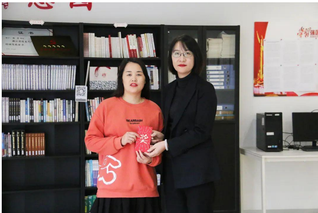
图 6 设立“光彩”奖学金制度

公司还特别关注一些特殊群体的需求，如关注女性员工的工作环境、工作时间、工作强度以及长期性的职业发展、公平机会等因素；充分发挥女职工的主力军作用，丰富女职工业余文化生活。在妇女节举办沙画蜡烛 DIY，代表公司领导对公司的女性员工的关怀与美好的祝福。