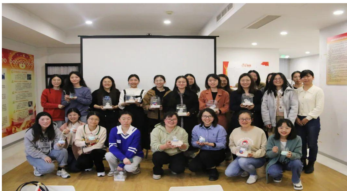
图 7 妇女节活动

公司还特别关注一些特殊群体的需求，如关注女性员工的工作环境、工作时间、工作强度以及长期性的职业发展、公平机会等因素；充分发挥女职工的主力军作用，丰富女职工业余文化生活。在妇女节举办沙画蜡烛 DIY，代表公司领导对公司的女性员工的关怀与美好的祝福。