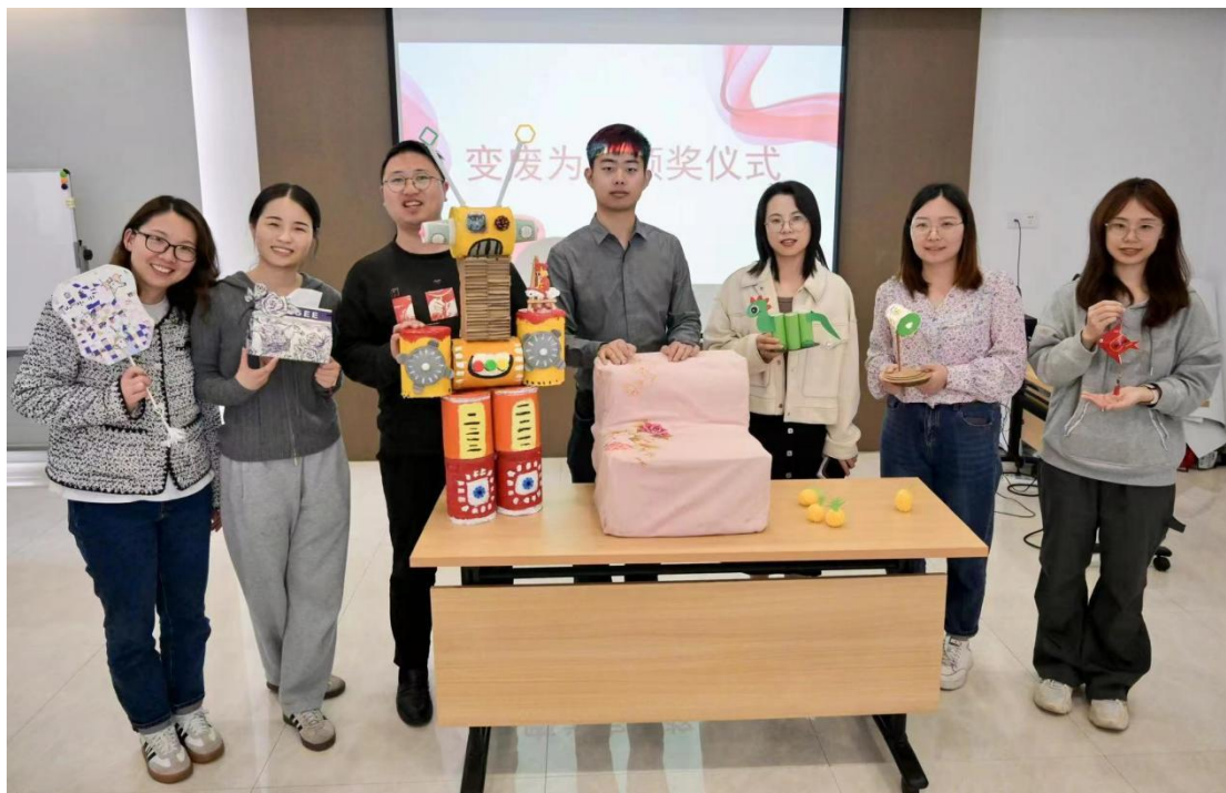
图 3 员工参加变废为宝环保主题活动

堂餐厅还配备空调，员工培训室，多功能活动室，文化广场等等。除了硬件保障之外，公司还通过诸如劳动技能竞赛、文娱活动等员工活动来调动员工的工作激情，丰富员工的业余生活，获得了员工的广泛好评。如下图：