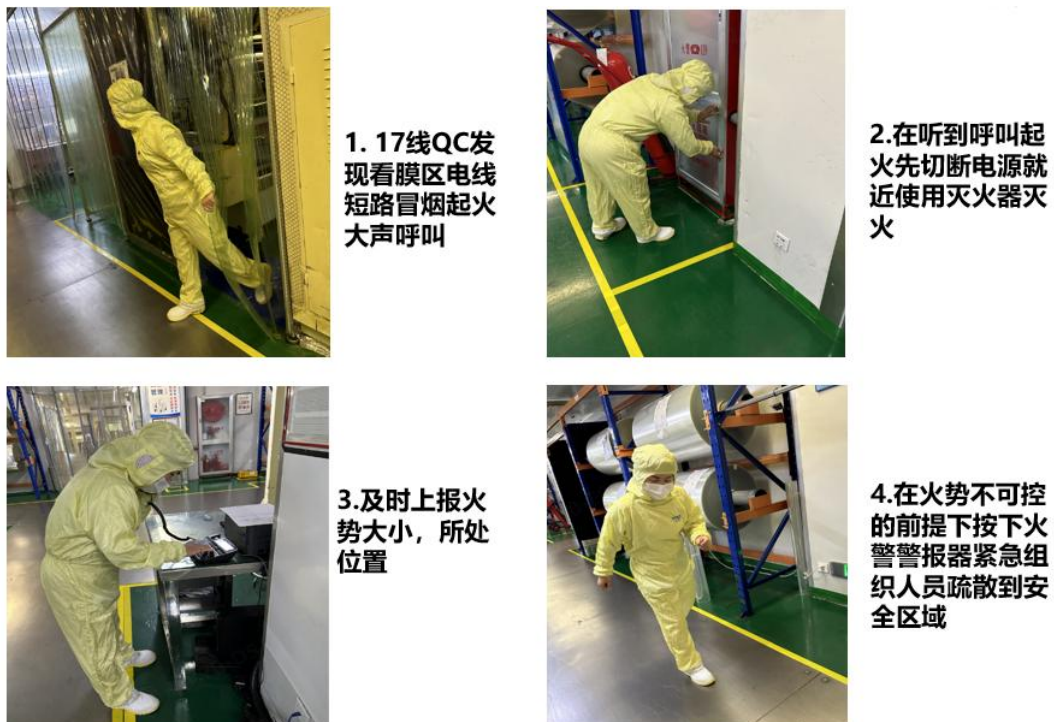
图 9 应急演练

针对可能发生的安卫风险，公司制订了应急预案，如《安全生产综合应急预案》、《突发环境事件应急预案》等在内的多项应急预案，充分发挥应急小组作用，保障员工的利益及避免因事故造成停产，及时满足顾客的需求。