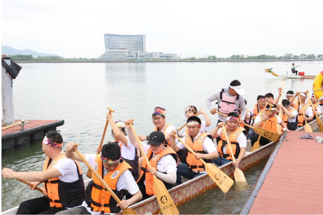
图 5 公司开展端午节划龙舟比赛

公司坚持“以人为本”，定期召开员工代表座谈会，员工满意度调查等活动及时了解员工的工作及生活改善，解决员工所关心的问题；为员工提供有竞争优势的薪酬，每天为员工提供营养均衡可口美味的午餐和晚餐；注重生产车间的技改创新，大力推行数字化智能化建设，逐步降低一线员工劳动强度；日常工作中，员工的奖惩公开透明，遏制不公；对于困难的员工，更及时给予温暖和人性关怀，如发放困难补助等，增强员工对公司的认同感和归属感。在 2021 年启程之际，激智“亲人计划”制定了《激智科技职工子女奖学金实施办法》，设立“光彩”奖学金制度，就是为了鼓励激智职工子女勤奋学习，发奋图强，闪耀光彩人生，为社会贡献力量。