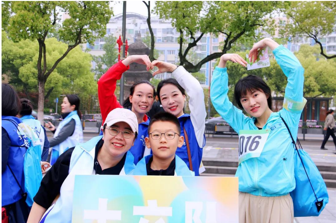
图 8 陪伴星宝公益活动

公司强调企业的社会责任，真诚回报社会。总经理十分重视公益支持事业，大力倡导并以身作则，公司领导也将随着企业的不断发展坚持不懈的把公益事业发展下去。根据所属集团的相关战略规划与支持，公司每年积极带领员工参与公益事业，关爱青少年成长，与“星宝”长期结对，设立公益基金。