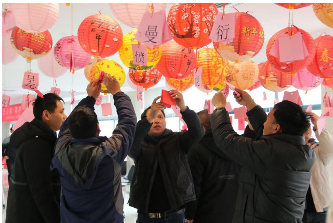
图 4 员工参加元宵节猜灯谜活动